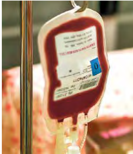
Symbolfoto: Frühgeborene benötigen aus unterschiedlichen Gründen Bluttransfusionen zum Überleben