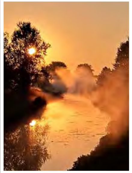
Sonnenaufgang über der Nieplitz

Da Sie, liebe Leser, uns im vergangenen Monat so viele schöne Impressionen aus unserer Stadt zugeschickt haben, möchten wir Ihnen auch alle Fotos präsentieren.