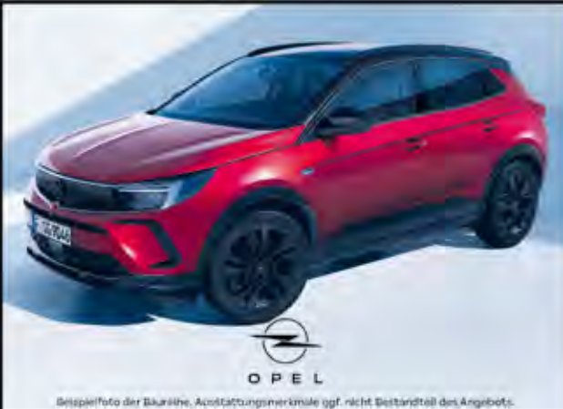
Beispielfoto der Baureihe, Ausstattungsmerkmale ggf. nicht Bestandteil des Angebots.

1 Google Services sind nach Auslieferung 4 Jahre gebührenfrei verfügbar. Daneben ist die Nutzung der Digital Services inkl. Google Services kostenpflichtig. Google ist eine Marke von Google LLC. 2 Ein Privatkunden-Kilometer-Leasing-Angebot der Volvo Car Financial Services - ein Service der Santander Consumer Leasing GmbH (Leasinggeber), Santander Platz 1, 41061 Mönchengladbach - für einen Volvo XC40 B3 Mid-Hybrid Benzin Plus Black Edition, 7-Gang Automatikgetriebe, Benzin, Hubraum 1.969 cm 3 , 120 kW (163 PS), Möbelische Leasingrate 239,00 Euro, Vertragslaufzeit 24 Monate, Laufleistung pro Jahr 5.000 km, Leasing Sonderzahlung 0,00 Euro, zzgl. Zulassungs-kosten. Bonität vorausgesetzt. Gültig bis 30.09.2024. Beispielfoto eines Fahrzeuges der Baureihe 1 die Ausstattungsmerkmale des abgebildeten Fahrzeuges sind nicht Bestandteil des Angebots.