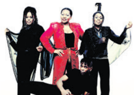
Liz Mitchell Boney M. R