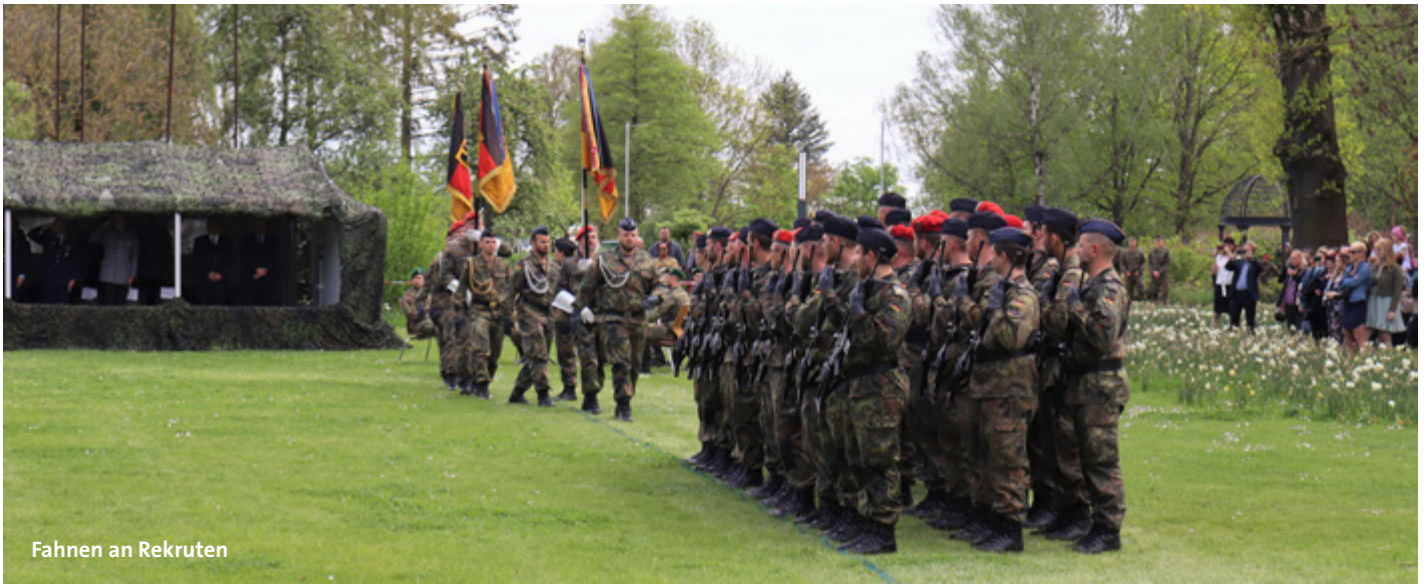
Fahnen an Rekruten

MEHR ALS 90 BUNDESWEHRREKRUTEN AM 11. MAI BEI GELÖBNISREDE DES MINISTERPRÄSIDENTEN ANWESEND