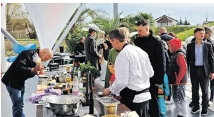
Schlange stehen am Essen