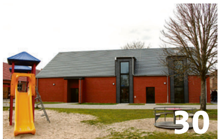
Buchholzer feiern neues Dorfgemeinschaftshaus direkt neben dem viel genutzten Spielplatz.