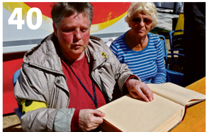
Allee der Inklunauten: Aktionswoche für Solidarität und Toleranz in Potsdam-Mittelmark