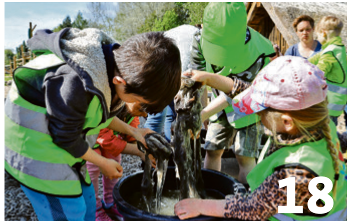
Grünes Klassenzimmer in neue Saison gestartet. 22 Kinder der Kita Kinderland bei erstem Kurs 2023. Noch wenige Termine buchbar.