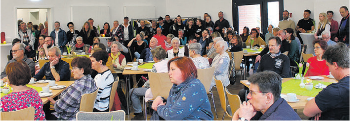
Der Anlass zog Jung und Alt gleichermaßen begeistert in die neue Dorfmitte.

ZUM FEIERN, BEISAMMENSEIN UND PROBEN MITTEN IM DORFZENTRUM