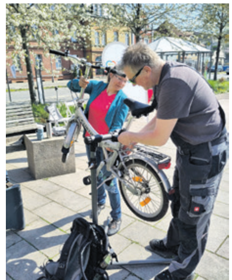
Ob Klingel reparieren, Schlauch flicken, ein paar Schrauben festziehen oder sich über recycelte Fahrräder informieren und probefahren – beim Repair-Café am 22. April war vieles möglich.