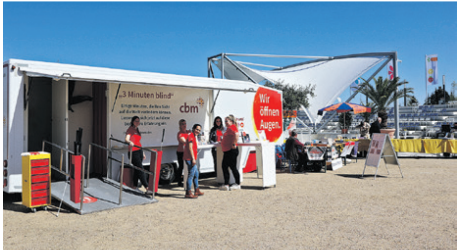
Am 3. Mai fand von 11 – 18 Uhr auf dem Festgelände im Stadtpark eine Ausstellung für blinde und sehbehinderte sowie körperlich beeinträchtigte Menschen statt.

Während in Deutschland ein funktionierendes Gesundheitssystem Betroffenen schnelle Hilfe ermöglicht, sind die