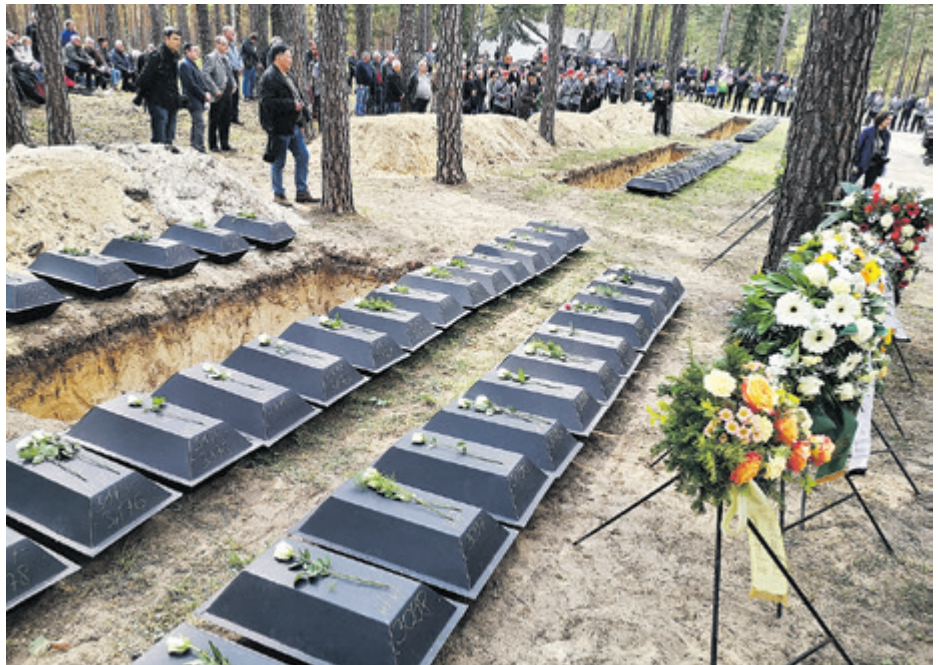
Einbettungsveranstaltung auf dem Waldfriedhof zu Halbe, Mai 2022