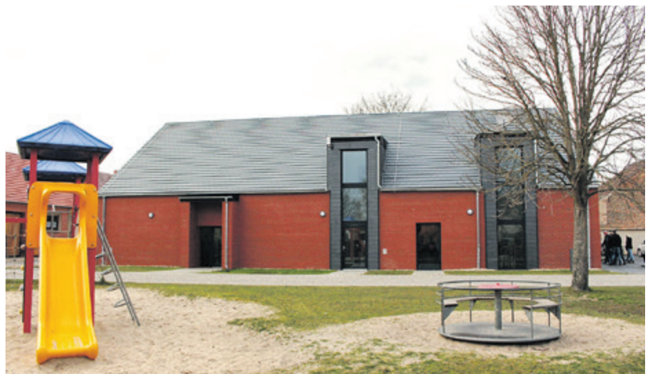
Das neue Dorfgemeinschaftshaus liegt direkt neben dem viel genutzten Spielplatz.