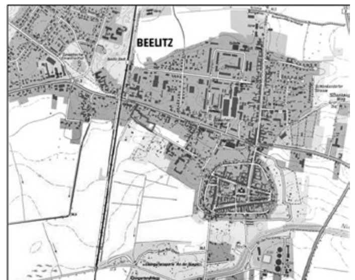
TK 10